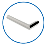
Drückerform Typ NT291