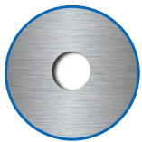
Zylinderausschnitt ausser, innen RZ

Die Produkte können von den dargestellten Bildern abweichen