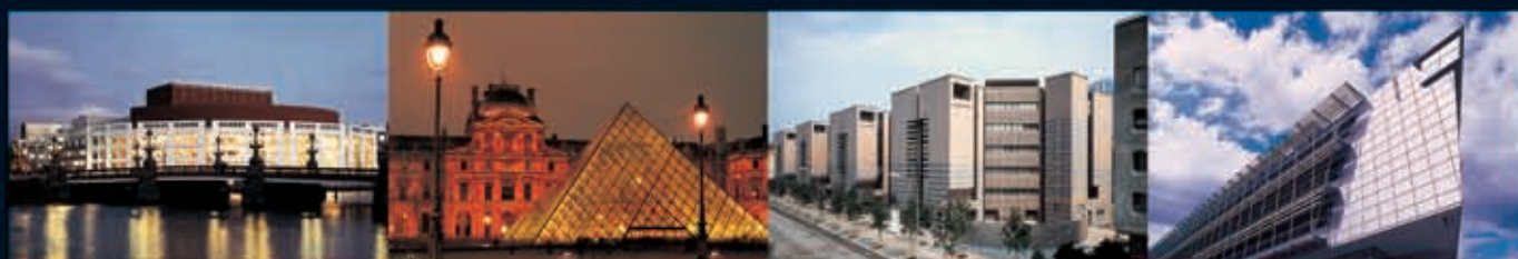
Rathaus, Amsterdam Louvre, Paris Banca del Gottardo, Lugano Titanic, Bern