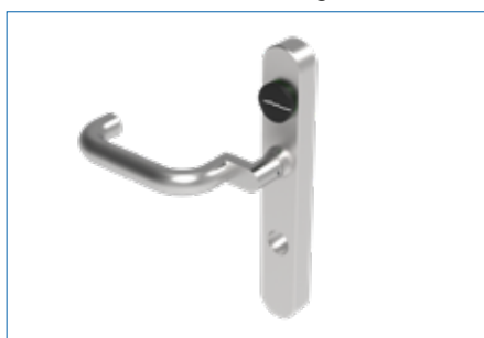
Drückerform U22 abgesetzt