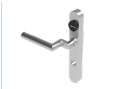
Drückerform L11 abgesetzt